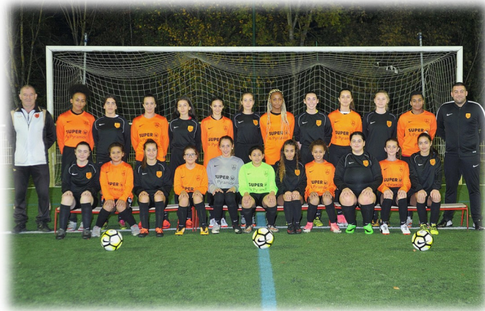
Féminines : U18 et U14