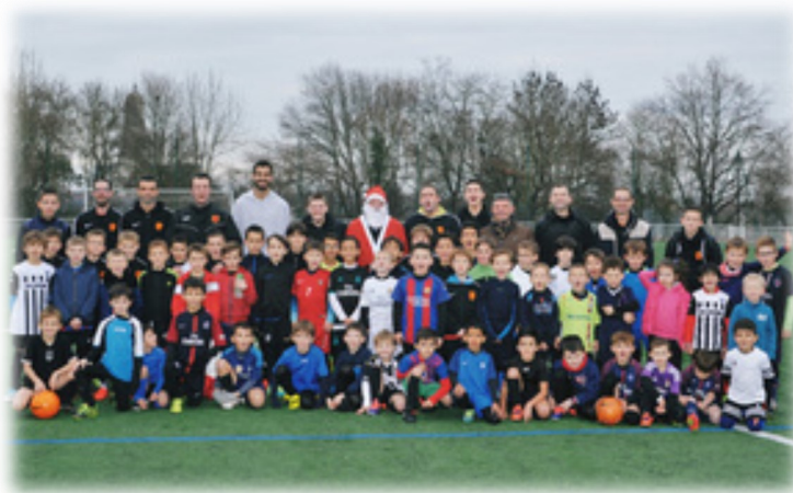
U6-U7 et U8-U9