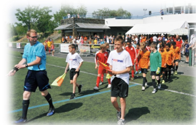
Tournoi U11-U13, saison 2016-2017

que la section féminine du club se développe....